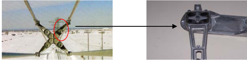
Figura 4 Articulación elástica

En la línea de transmisión, para determinar el comportamiento del sistema de protección antivibratoria, se hacen mediciones de vibraciones eólicas como se puede observar en la Figura 5.