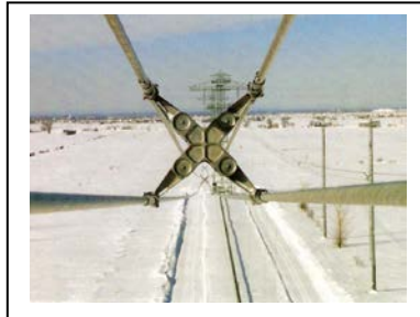
Figura 1 Espaciador amortiguador

Para lograr la geometría del haz, y mantenerla por la acción de los fenómenos eólicos y eléctricos, se dispone de una serie de espaciadores amortiguadores, dispuestos a lo largo de cada vano, con una determinada tabla de posicionamiento. En la Figura 1 se puede observar una imagen tipo, con tres fases, conformadas por haces de conductores cuádruples con los correspondientes espaciadores amortiguadores.