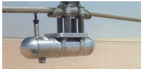
Figura 5 Medición de vibraciones eólicas

En la línea de transmisión, para determinar el comportamiento del sistema de protección antivibratoria, se hacen mediciones de vibraciones eólicas como se puede observar en la Figura 5.