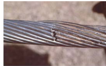
Figura 3 Morsa de suspensión y fenómeno de fatiga

En haces de conductores, el subconductor de sotavento está influenciado por el desprendimiento de sus propios vórtices y por los desprendidos del subconductor de barlovento. El subconductor de barlovento no está influenciado por el de sotavento. Como los subconductores están vinculados por los espaciadores amortiguadores, se genera un fenómeno de inestabilidad del haz, denominado oscilaciones de subvano. La forma más común de este fenómeno consiste en la oscilación de un par de conductores casi horizontales en movimiento antifase, donde cada conductor describe una trayectoria elíptica. El movimiento ocurre a frecuencias próximas a 1 Hz. La amplitud de las oscilaciones puede dar lugar a posibles choques entre pares de conductores.